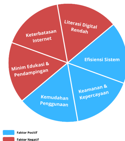
Gambar 3. Pengaruh e-Filing terhadap Kepatuhan Wajib Pajak

Untuk memberikan gambaran visual mengenai temuan ini, berikut adalah diagram yang menunjukkan pengaruh e-Filing terhadap kepatuhan wajib pajak: